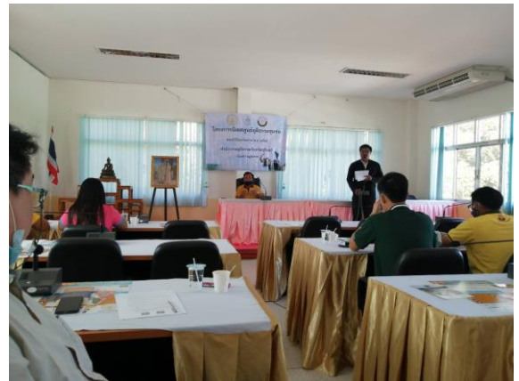
การส่งเสริมพัฒนาบุคลากรในหน่วยงานในหลักสูตรต่าง ๆ